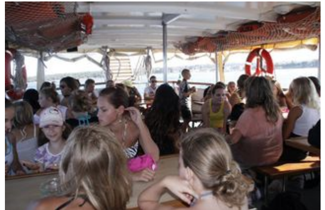
Výlet na lodi byl nezapomenutelný