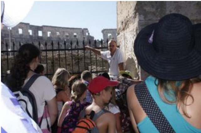
Amfiteátr v Pule jsme viděli na vlastní oči i s výkladem