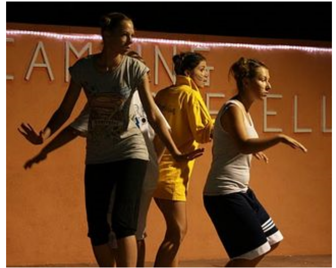
U moře došlo i na tanec